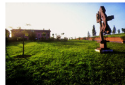
CÀ LA GHIRONDA Ponte Ronca Zola Predosa (Bo)