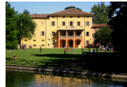
VILLA SMERALDI San Marino di Bentivoglio (Bo)