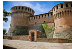
ROCCA DI DOZZA Dozza Imolese (Bo)