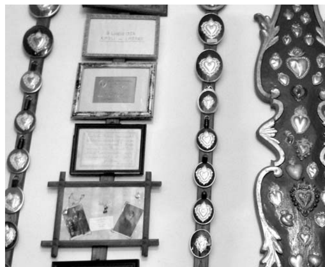
Ex voto nel Santuario di Boccadiviro

Montovolo. Storia, natura e leggenda , dvd, regia di Riccardo Maria Soriquez, Bologna, Eco.Logica. Mente, 2009 CVCL 914.541 MONTO