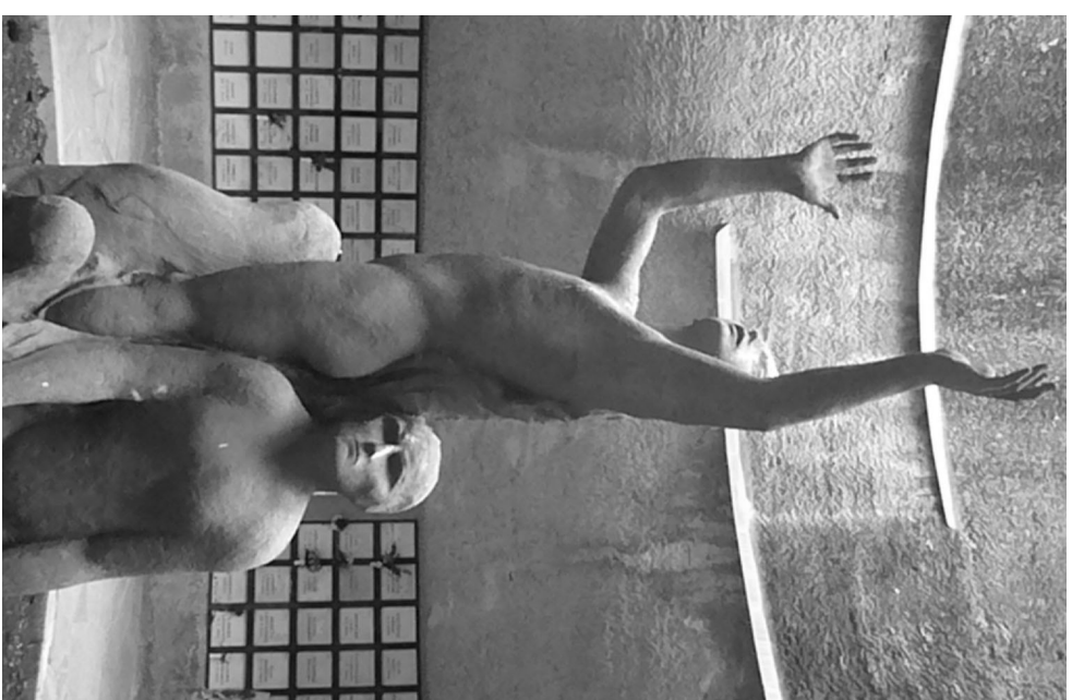
Le immagini sono tutte del Monumento Osario dei caduti partigiani nella Certosa di Bologna, arch. P. Bottoni

Biblioteca Sala Borsa Piazza Nettuno 3, Bologna telefono 051 2194400 fax 051 2194420 bibliotecasalaborsa@comune.bologna.it www.bibliotecasalaborsa.it