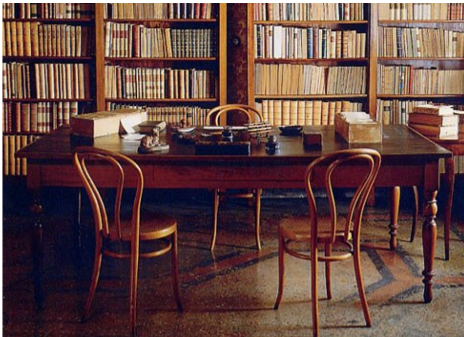
Nello studio di Giosue Carducci: il tavolo da lavoro

Non c'è oggetto e cimelio, mobile e quadro, arredo e suppellettile ornamentale che non sia legato al famoso padrone di casa e non racconti la storia della sua vita, rievocando episodi salienti della sua instancabile attività culturale. Muovendo dall'esame di alcuni significativi contenuti, scopriamo come questo contenitore possieda i tratti tipici dell'autoritratto e dell'autobiografia, luogo favorito dove lo scrittore costituisce ed offre di sé una particolare immagine che è quella dell'umanista amante dei propri studi, in perenne colloquio con i suoi libri, ricercati con passione e vera ed unica consolazione della sua vita.