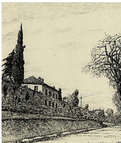
Casa Carducci nel 1901 in un disegno a china di Venturino Venturini

La guida è pronta a soddisfare i vari quesiti dei visitatori, fornendo inoltre materiali di studio e di ricerca conservati dalla biblioteca di Casa Carducci, consultabili in sede.