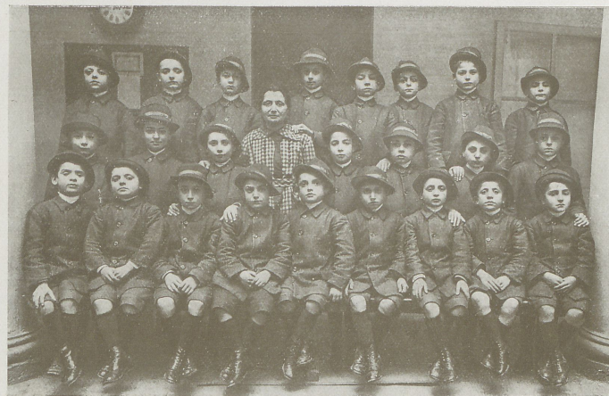
La seconda squadra in tenuta invernale da lavoro.

primo il carattere, le tendenze, le qualità buone nascoste od in germe, e di trovare i mezzi adatti per estirpare le brutte abitudini, e far nascere rigogliosa la virtù; occorreva disciplinare questi bimbi abituati alla sfrenata libertà delle strade e dei campi. E la lotta, a vero dire, fu dura; ma proseguita con energia giovanile dagli Istitutori, fu coronata da ottimo successo. Costoro, aiutati dai consigli del Direttore, cominciarono a seguire quell'in-