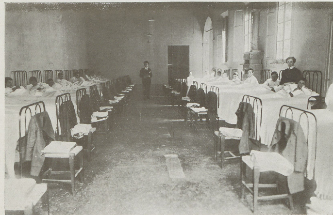
La camerata dei « Grandi ».

Certo non fu tutta seminata di rose la via che si dovette percorrere per giungere a tali risultati, poichè si dovette lottare con tendenze ataviche