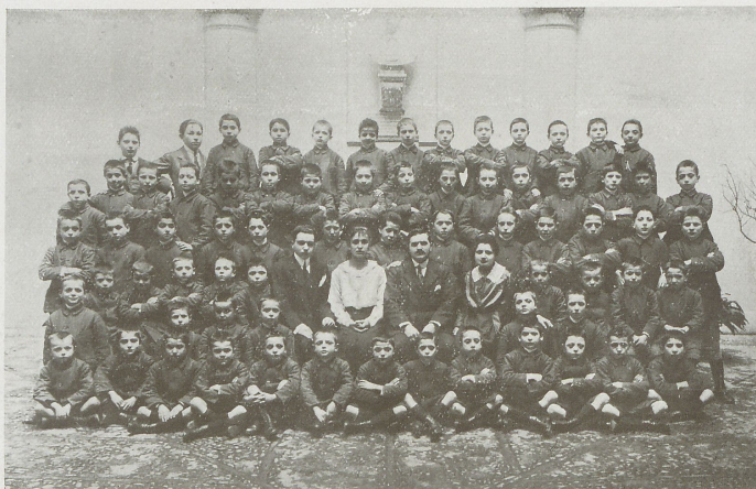
Le tre squadre riunite.

Il Consiglio del nuovo Ente, convinto dell'opportunità di iniziare la beneficenza al più presto possibile, dispose che fosse riattato l'antico Orfanotrofio di S. Bartolomeo, in via Riva Reno N. 120, in attesa di poter