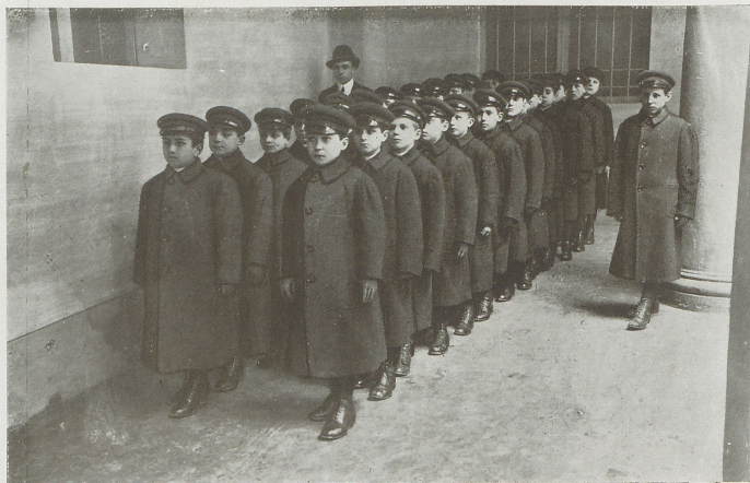
La prima squadra in tenuta invernale da passeggio.

Perchè i bimbi prendessero amore alla pulizia, furono abituati a fare spesso il bagno ed a lavarsi molto bene la faccia, il collo e le mani. Per abituarli a tenere in ordine i loro indumenti si fecero visite giornaliere molto meticolose, consigliando ed ammonendo pazientemente chi si divertiva a