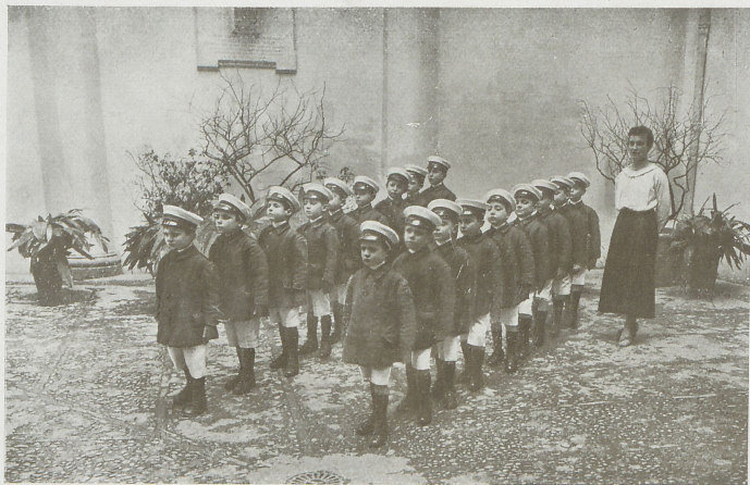
La squadra dei piccoli in tenuta estiva da passeggio.

Il 1° settembre, dunque, l'Orfanotrofio Maschile Bolognese fu pronto per ricevere i primi 58 allievi, i quali furono accolti, dopo il bagno ed il cambiamento di biancheria e di vestiario; poichè l'Amministrazione aveva