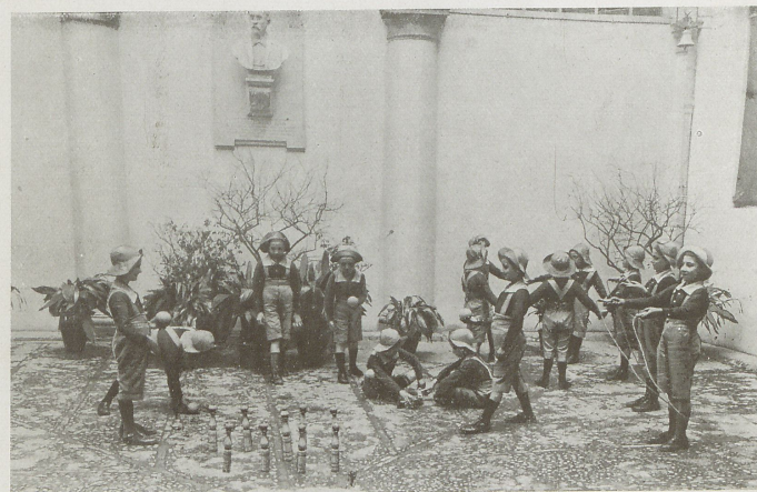
I più piccoli in tenuta estiva da gioco.

donati nel senso più assoluto della parola, poi ai figli naturali riconosciuti da uno dei genitori, rimasti orfani; ed infine agli orfani di un genitore, che avessero l'altro genitore ammalato od impossibilitato a provvedere al loro mantenimento ed alla loro educazione. Si decise anche che i ragazzi sarebbero stati mantenuti nell'Istituto fino al compimento del 18° anno di età ed avviati da un'arte o ad una professione, a seconda delle rispettive inclinazioni ed attitudini.