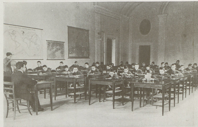
Una sala da studio.

Molte lettere delle maestre delle pubbliche scuole e soprattutto la statistica dei promossi nel terzo bimestre, ( vedi Allegato N. 9 ), attestano la verità