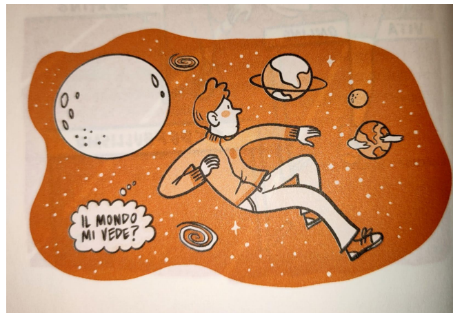
Cirillo, Lancini; 2022

“Onlife” in classe: da monomedialità (uomo - libro) a multimedialità.