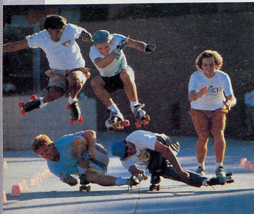
Le acrobazie di un gruppo di pattinatori.