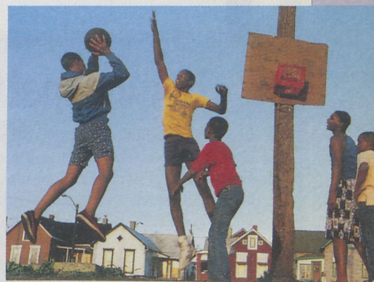
Lo street basket si pratica ovunque: basta che ci siano sei giocatori e la partita può cominciare.