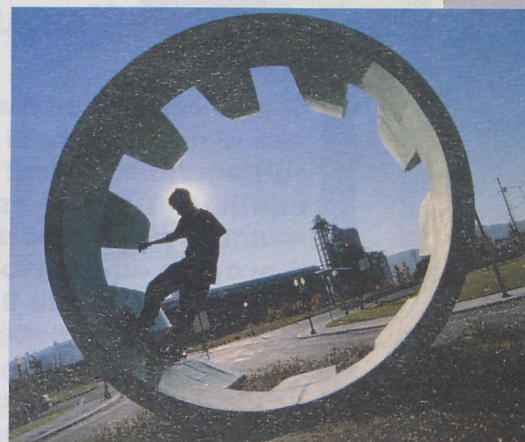
Uno skateboarder sta prendendo il ritmo per arrivare il più in alto possibile sulla parete di cemento.

Si inizia con qualche palleggio di riscaldamento e, quando si vuole, comincia la partita, con le stesse regole del basket. Alla fine degli anni ottanta lo street basket è arrivato anche in Italia e oggi è largamente praticato. Visto il numero ridotto di giocatori, anche il campo è la metà di quello normale, mentre i canestri sono alla solita altezza. Basta trovare uno spazio e il gioco è fatto. Da qualche anno si gioca addirittura in spiaggia, non sulla sabbia, ma su una superficie dura, con veri e propri tornei e campionati.