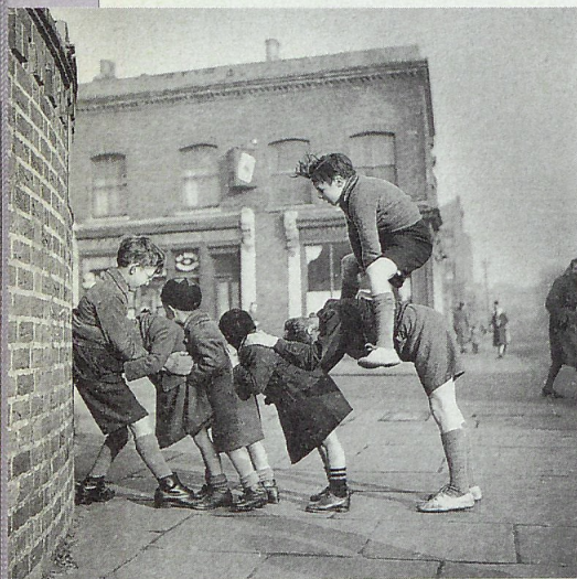
Una versione di "uno monta la luna" piuttosto complicata.

Che cos'è una strada di campagna? Quella non asfaltata, potrebbe rispondere un ciclista. Anche se c'è strada e strada. La più classica corsa in bicicletta su