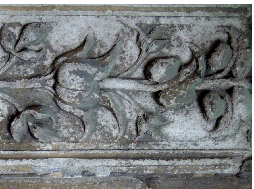
Decorazione del portale di Palazzo Felicini, via Galliera, 14

La città di Bologna parla del governo di Giovanni II in un'anonima canzone popolare alla fine del Quattrocento