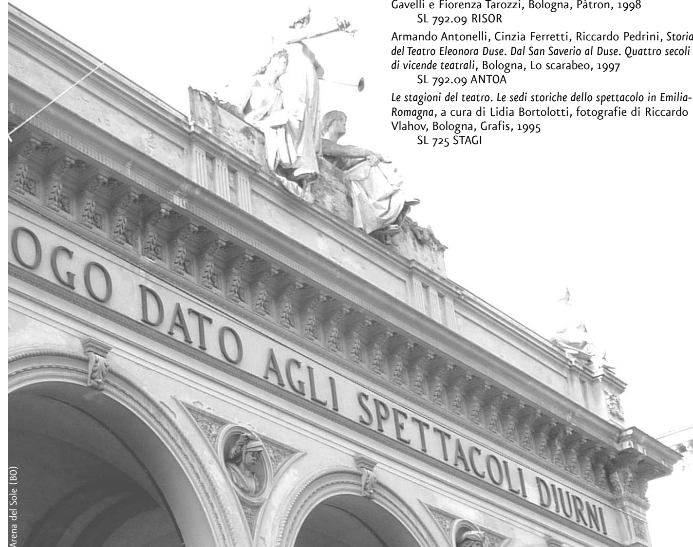
Arena del Sole (BO)

Renzo Giacomelli, Il Teatro comunale di Bologna. Storia aneddotica e cronaca di due secoli (1763-1963) , Bologna, Tamari Editori, 1965 SL 780.94 GIACR