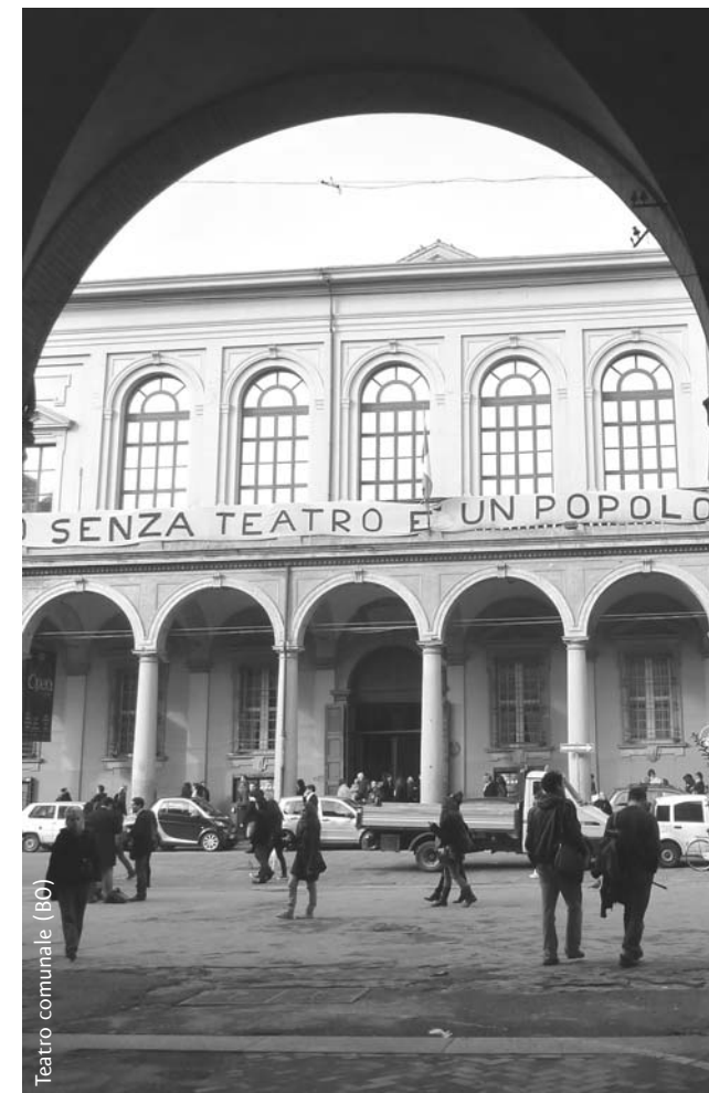
Teatro comunale (Bo)

FONDAZIONE DEL CASSA DI RISPARMIO IN BOLOGNA