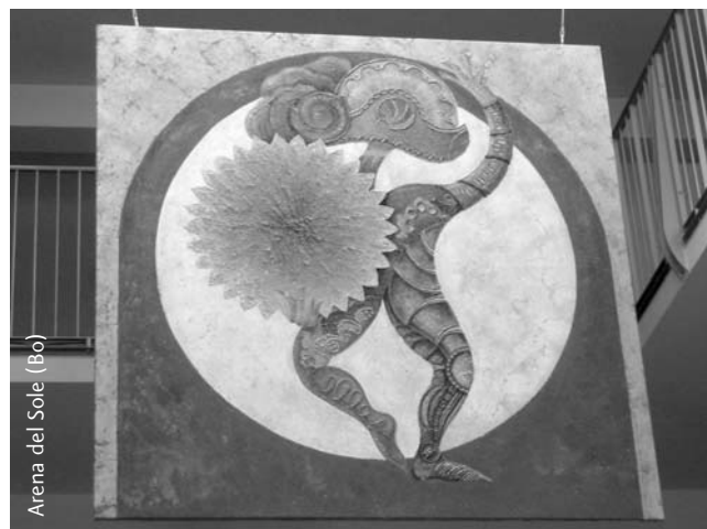
Arena del Sole (Bo)