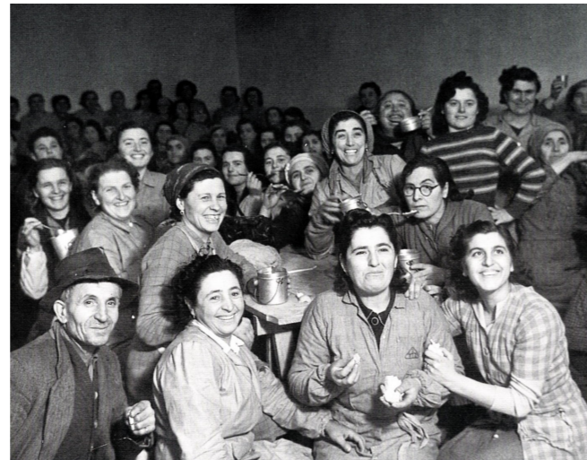
Operaie della Barbieri e Burzi nella fabbrica occupata, gennaio 1948

Luigi Arbizzani, Sguardi sull'ultimo secolo. Bologna e la sua provincia, 1859-1961 , Bologna, Galileo, 1961 SL 945.41 ARBIL