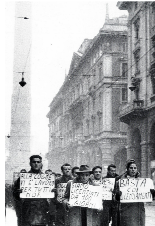
Un gruppo di lavoratori della Cogne manifesta in via Rizzoli nel dicembre 1954

> l'area fumetti, giochi e sport si trova nella veranda di scuderie (piano 0)