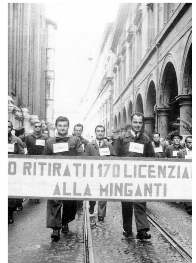
Licenziati della Minganti alla manifestazione del 1° maggio 1954 lungo via dell'Archiginnasio

Resoconto della manifestazione del 4 settembre 1946 su "Il Progresso d'Italia)