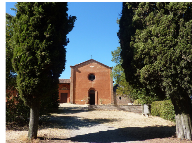
Chiesa di san Vincenzo a Ronzano