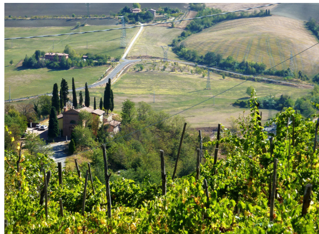
La chiesina di Jola da Forte Bandiera

Bologna. La collina , Bologna, Editrice Compositori, 2010 SL 914.541 BOLOG