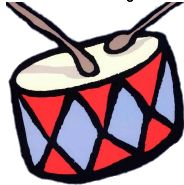
immagine tratta da: Luccellino fa..., Soledad Bravi, Babalibri

Prosegue la rassegna di film per bambini. Dopo l'esordio con le proposte dell'associazione Gli anni in tasca - Un film nello zaino , si prosegue con Schermi & Lavagne e Future Film Kids . Le proposte del Ffkids sono: > sabato 6 novembre, ore 16 Kamillo Kromo e altri amici , di Enzo D'Alò e altri autori, 50', animazione Un'antologia di cartoni animati, in cui si fa la conoscenza di Kamillo Kromo, il camaleontino creato da Altan, e di altri simpatici personaggi animati. Si ringrazia Gallucci Editore. > sabato 27 novembre, ore 16 I cortometraggi dell'Europa dell'est , di Starevich e Trnka, 60', animazione Tre cartoni animati di origine russa e cecoslovacca, diretti da Ladislav Starevich e Jiri Trnka. Nel primo, The Mascot , che ha ispirato Toy Story , un gruppo di giocattoli dispersi cerca la strada di casa; il secondo, The Merry Circus , illustra lo spettacolo di un circo, mentre The song of The Prairie racconta una buffa storia western.