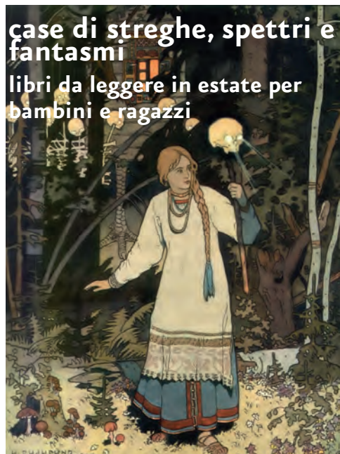
illustrazione di Ivan Bilibin